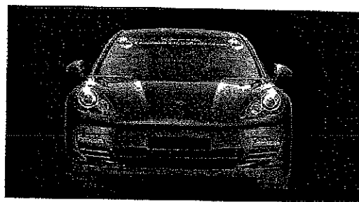
A sinistra la Panamera Hybrid su strada; sopra il frontale sportivo; a destra la barca a vela Sly 42 Fun