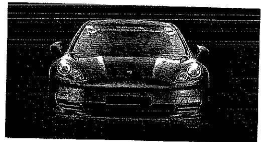
A sinistra la Panamera Hybrid su strada; sopra il frontale sportivo; a destra la barca a vela Sly 42 Fun